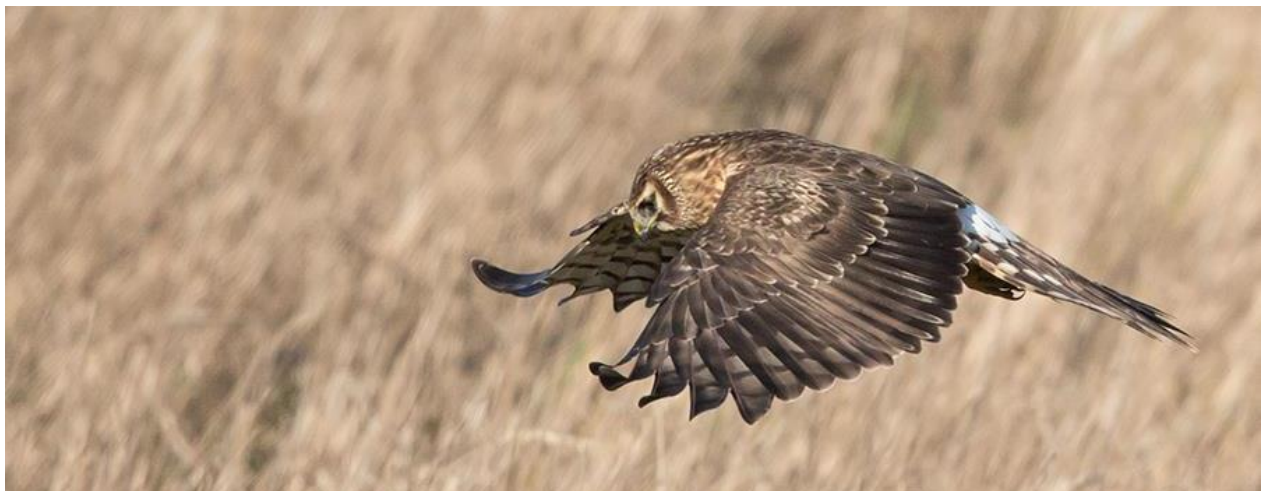
Blauwe Kiekendief, vrouwtje

Traditioneel houden we bij het begin van het jaar een Roofvogelteldag. We trekken erop uit in diverse vallei- en natuurgebieden om de overwinteraars te inventariseren, vnl. roofvogels, meeuwen en Kieviten. Op de meeste plaatsen wordt het een combinatie van autotocht met korte wandelingen. We verwachten overal een handvol geïnteresseerden. Wie graag zelfstandig elders en synchroon een route wil lopen, meldt dit liefst vooraf (Marcel tel. 016 81 87 87).