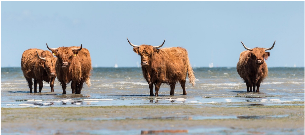
Grote grazers op Tiengemeten

Oude wegen werden verwijderd. Kreken werden hersteld. Landbouwgrond werd omgezet in moeras. Natuur werd hersteld. Grote grazers werd ingezet voor beheer.