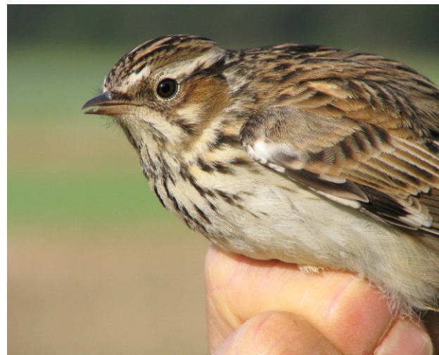
Nachtzwaluw – Boomleeuwerik bij ringwerk, Johan Van Autgaerden

Afspraak: te Leuven , Carpoolparking Herent E314 bij Mechelsesteenweg om 17.45 u. Te Zonhoven om 18.30 u. op parking 'De Teut', hoek Donderslagseweg/ Teutseweg. Neem afrit 29 van de E314, richting Hasselt en aan de eerste verkeerslichten naar links en altijd rechtdoor waarna je op de parking uitkomt. Einde omstreeks 23.30 u.