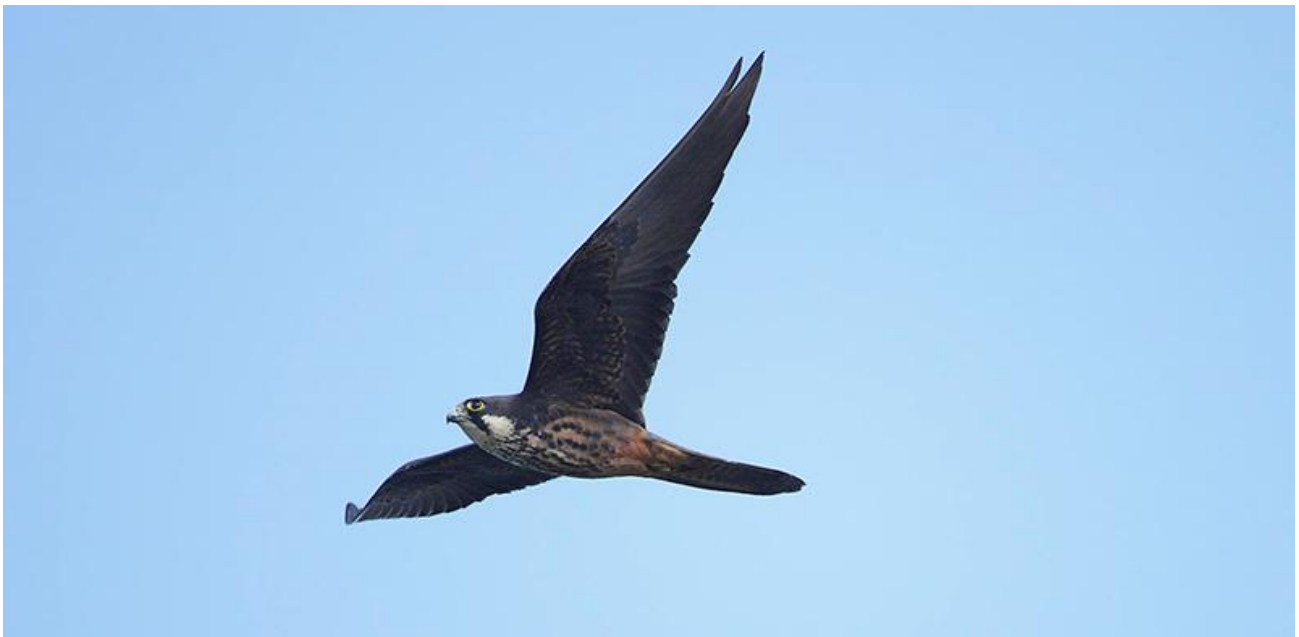
Foto: Eleonora's Valk

Zoals je kan zien heel wat minder gebruikelijke soorten van Zuidoost Europa. Daarop nog een sausje van doorgaans zonnig weer, overgoten met een Grieks sausje van lekker eten en een goed glas wijn! Kortom alle ingrediënten om van deze dertien daagse vogel- en natuurreis een topper te maken.