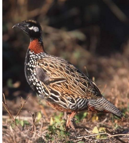
Smyrna IJsvogel en Zwarte Frankolijn