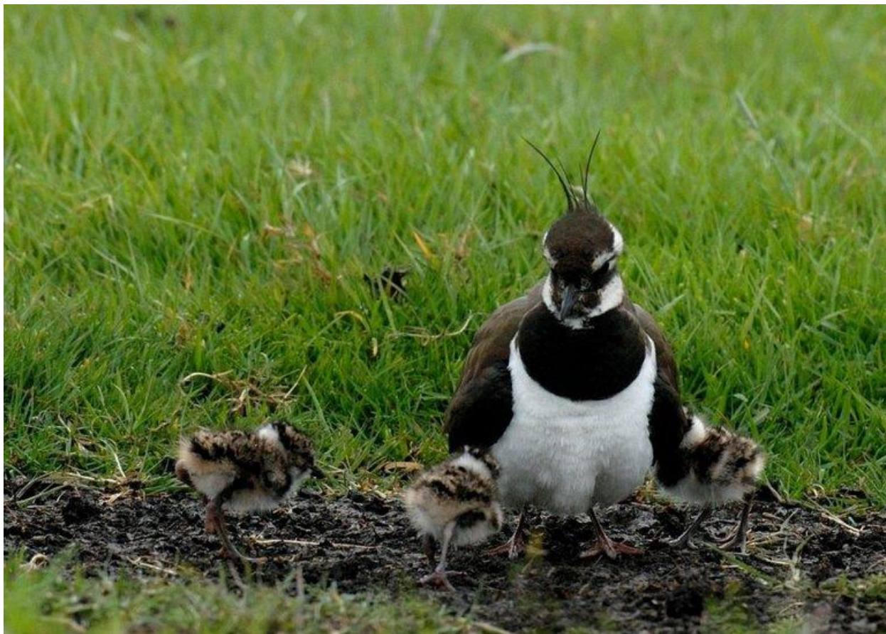
Kievit met jongen

procent van de oppervlakte per agrarisch bedrijf te reserveren voor natuur- en landschapselementen en voor delen waar geen gif wordt gebruikt.