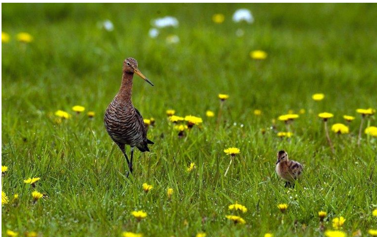
Grutto met kuikens

Vogelbescherming is ervan overtuigd dat we het tij kunnen keren. Daarom hebben wij demissionair minister Schouten van LNV en de Tweede Kamer een stevige brief geschreven. Hierin leggen we uit waarom het nu niet lukt om de boerenlandvogels te beschermen. Daarnaast stellen we een pakket voor van urgente en wérkelijk effectieve beleidswijzigingen en maatregelen, die het mogelijk maakt om gezonde populaties boerenlandvogels voor ons land te behouden. De zorg hiervoor is niet vrijblijvend. De rijksoverheid draagt de verantwoordelijkheid voor het naleven van internationale verplichtingen die gelden voor het behoud en herstel van de weidevogels en hun leefgebieden.