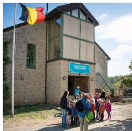
Bezoekerscentrum Webbekoms Broek

Lezing over Natuurpark de Brenne in Frankrijk Woensdag 8 maart Aanvang 19.30 u.