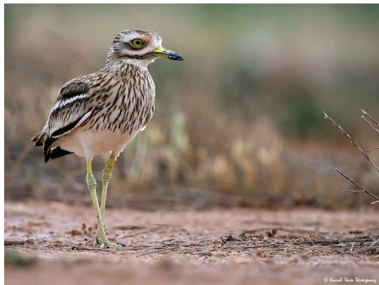
Twee broedvogels uit La Brenne; Purperreiger en Griël, foto's Karel Van Rompaey