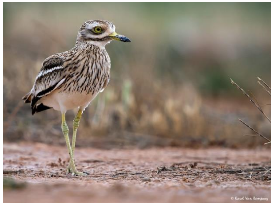
Twee broedvogels uit La Brenne; Purperreiger en Griel

Voorstellen en bijdragen voor ons tijdschrift maar ook voor de activiteitenkalender of de nieuwsbrief zijn altijd welkom! Wie stelt zich kandidaat voor verslagen e.d.?