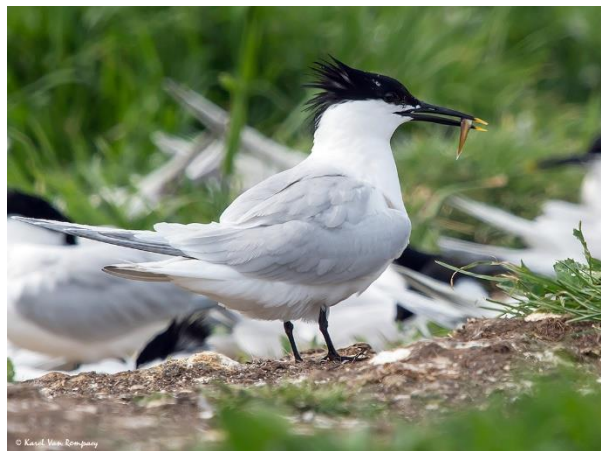
Kluut en Grote Stern, twee broedvogels van Het Zwin, foto's Karel Van Rompaey