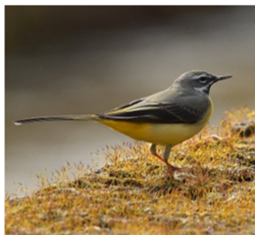
Gekraagde Roodstaart en Grote Gele Kwikstaart