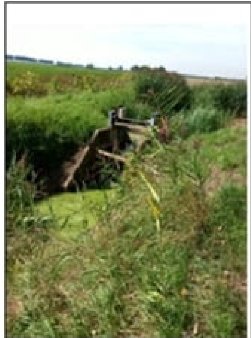
Twee foto's van Luc Cieters; links vluchtheuvel, rechts sluis.

Vanaf 13 u. is de picknick voorzien in café het Angeluus, bij de kerk van Prosper, de soep zal klaarstaan. Daarna gaan we naar de Hedwigepolder. Een mooie wandeling en teruglopen kan langs dezelfde weg. Dit is niet saai, integendeel, zelfs blijven staan (zitten) op eenzelfde plaats is boeiend, want het getij verandert de omstandigheden elke minuut gedurende zes uur en de vogelsoorten reageren op die specifieke veranderingen m.a.w. op dezelfde plaats terugkeren na bv. 2 uur levert een heel ander beeld op.