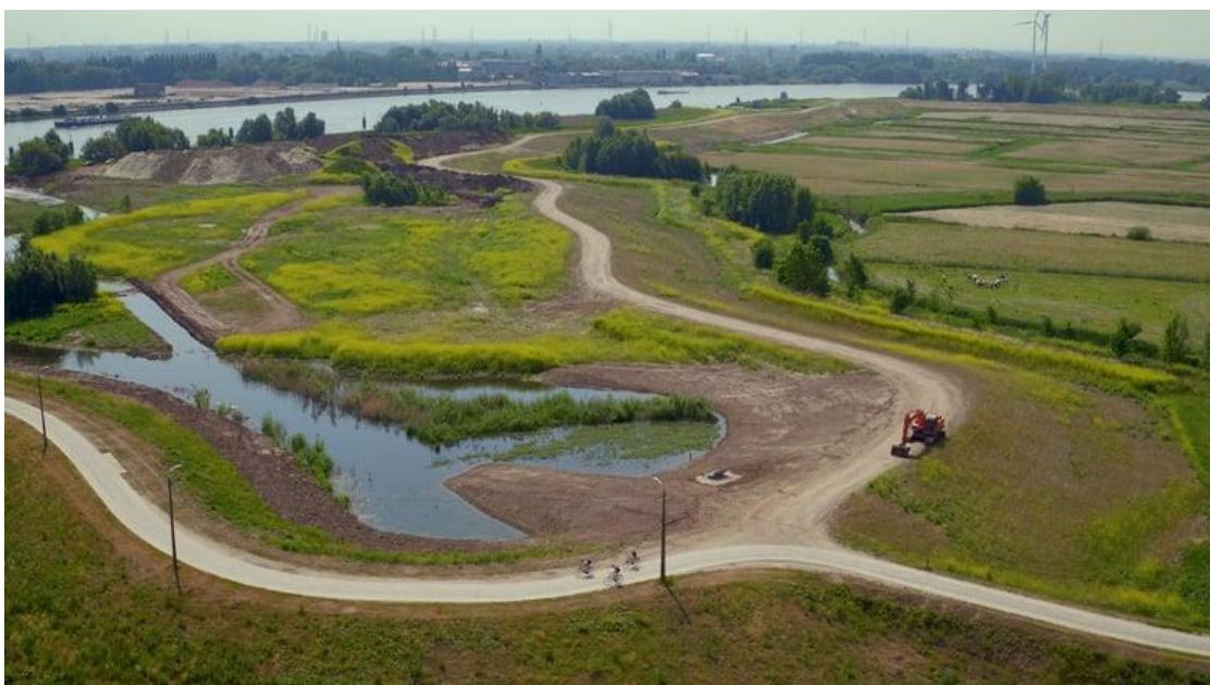
Polder van Kruibeke

Afspraak: Leuven, Carpoolparking Herent E314 bij Mechelsesteenweg om 8.00 u. of ter plaatse om 9.15 u. op de parking van de sporthal De Dulpop, Beekdam 1, Bazel (Kruibeke). Einde ter plaatse omstreeks 17 u.