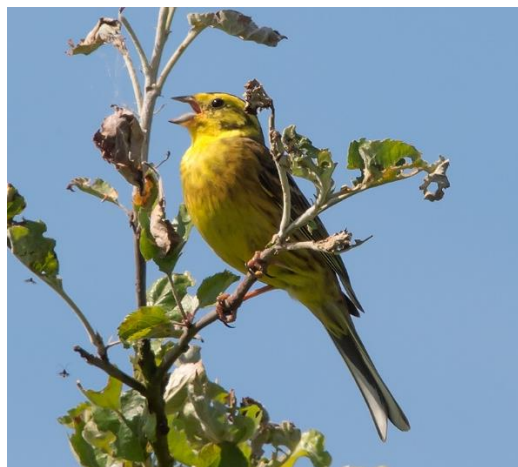
Wulp en Geelgors