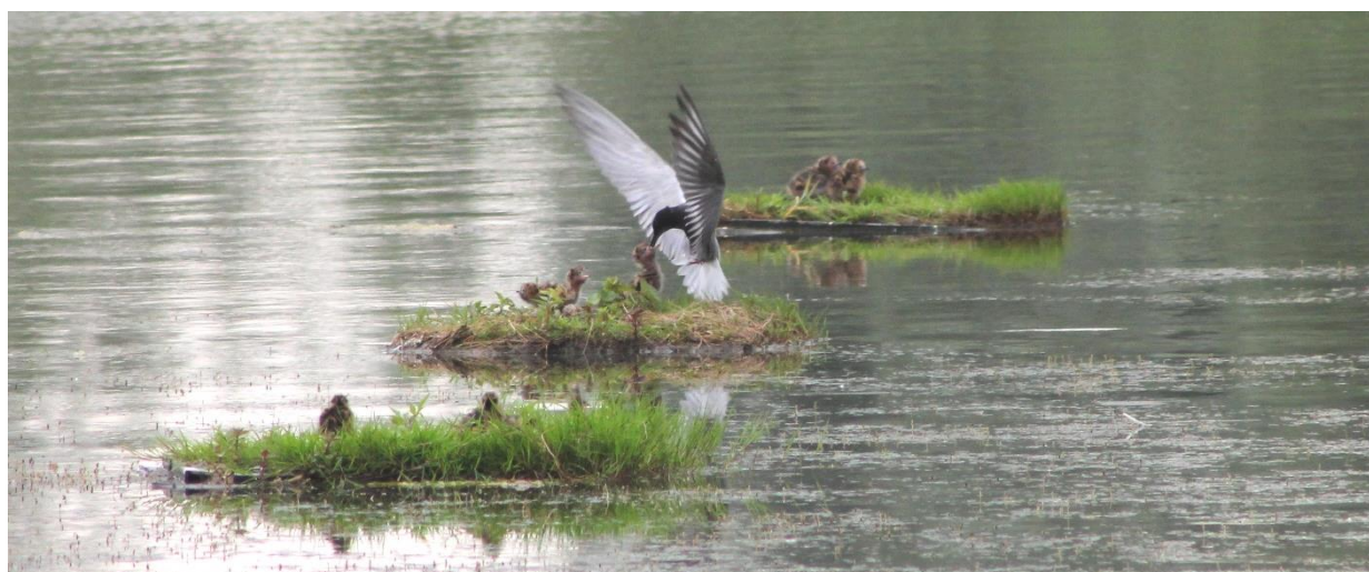
Zwarte Stens, foto Marleen Regent bij vorig bezoek

In de Millingerwaard is in 1993 de natuurontwikkeling gestart en naarmate er meer terrein wordt verworven krijgen we meer natuur. Natuur zonder afrasteringen waar iedereen vrij kan rondlopen. Na inrichting zorgen grote grazers in familieverband zoals Gallowayrunderen en Konikpaarden en de Bever voor de vorming en behoud van een dynamisch landschap met een afwisselende structuur en een fijnschalige mozaïek aan soorten. Tot het streefbeeld behoren ook Zeearend en Zwarte Ooievaar; maar die komen er voorlopig enkel onregelmatig pleisteren. Maar soorten als Zwarte Stern en Kwartelkoning voelen zich thuis in de uiterwaarden. De ontwikkeling van Ooibos met o.a. de zeldzame Zwarte Populier op plaatsen langs de uiterwaarden die langdurig onder water staan leidt tot het ontstaan van nieuwe ‘oerbossen’!