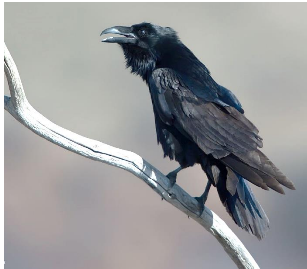
Kruisbek, foto Marc van Meeuwen en Raaf, foto Karel Van Rompaey