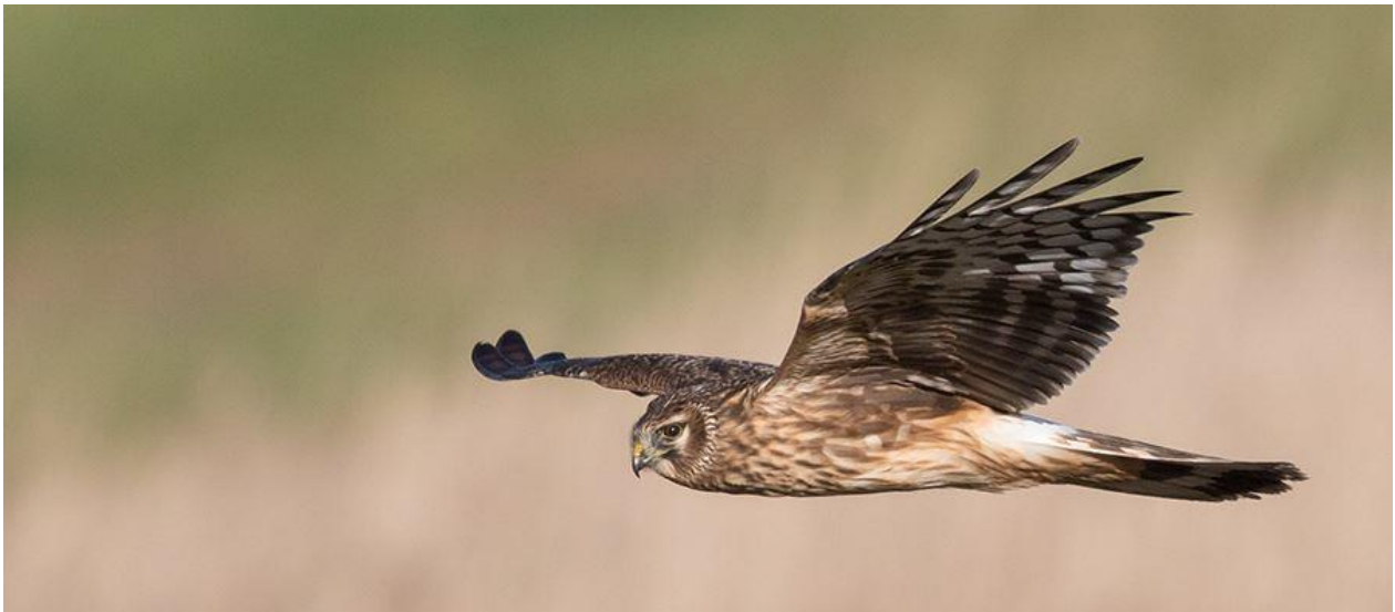
Blauwe Kiekendief, vrouwtje

Om 13.30 u. zal er een korte voordracht gegeven worden door Wim Bovens, project-coördinator van Natuurwerkgroep De Kerkuil over kiekendieven; korte soortbeschrijving, maar vooral over nestbescherming in het veld in samenwerking met de landbouwers. De PowerPoint over het broedsucces van Grauwe Kiekendieven (eventueel ook over Bruine Kiekendieven), zal sowieso voor de ervaren vogelkijker een warm gevoel brengen over de passie waarmee vogelaars in de werkgroep het veld in trekken.