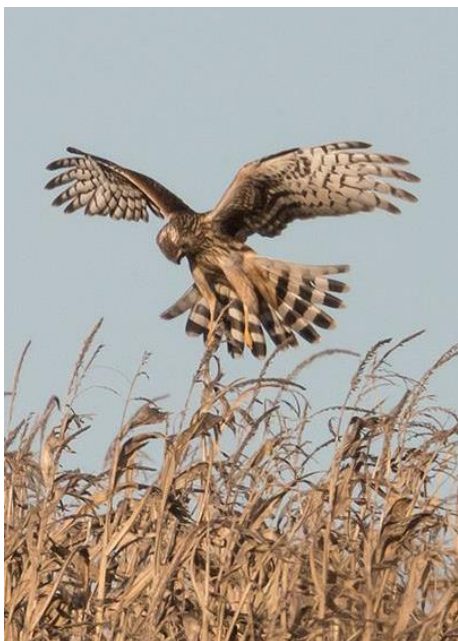
Blauwe Kiekendief