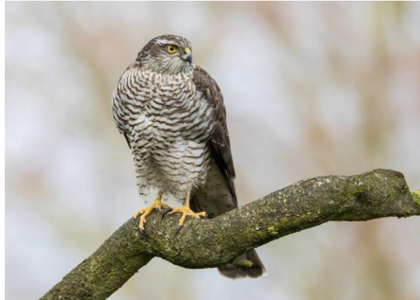
Torenvalk, foto Karel Van Rompaey – Sperwer, foto Marc Van Meeuwen