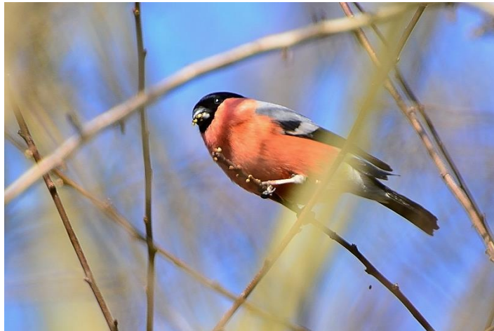
Middelste Bonte Specht – Goudvink