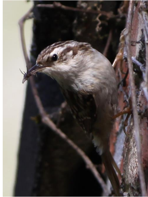
Grote Bonte Specht en Boomkruiper, foto's van Willy Ceulemans