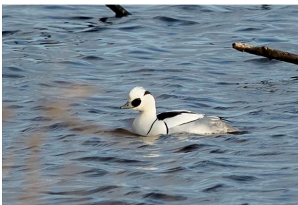
Twee mannetjes: Smient, foto Marc Van Meeuwen – Nonnetje, foto Karel Van Rompaey