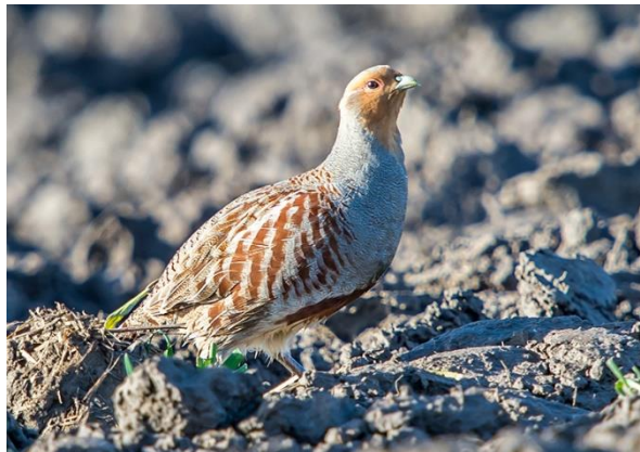
Geelgors – Patrijs