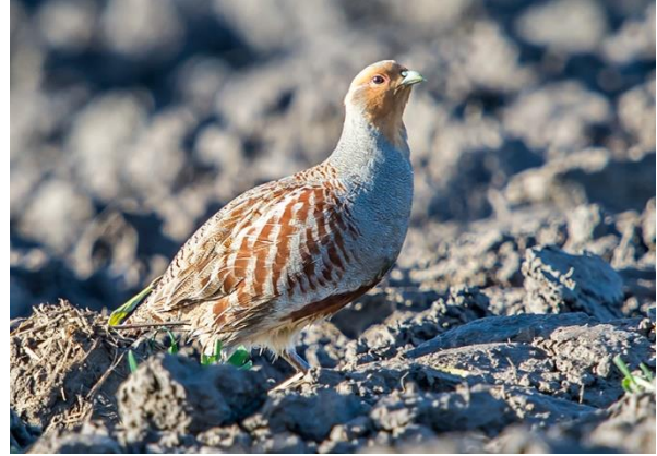
Geelgors – Patrijs