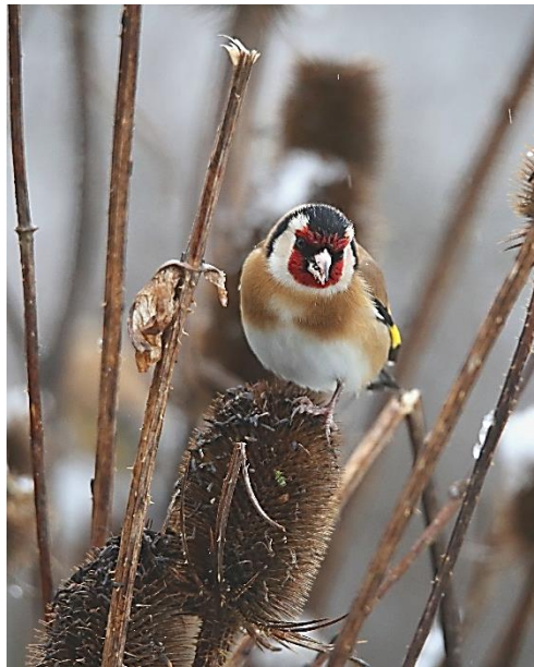
Boomklever en Putter