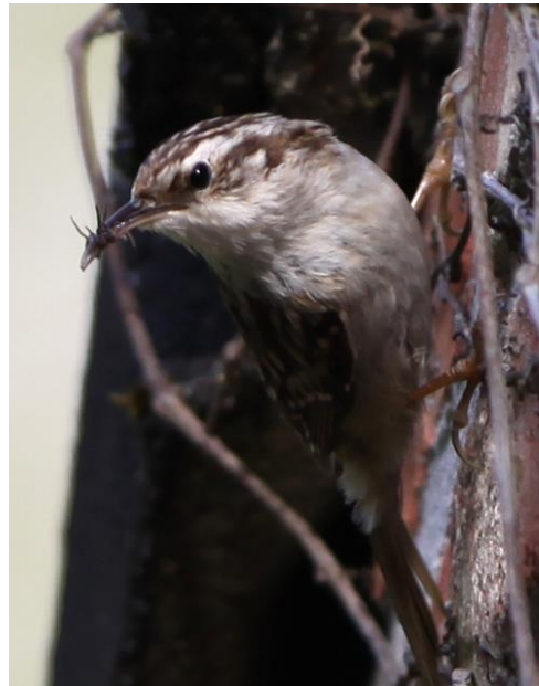
Grote Bonte Specht en Boomkruiper