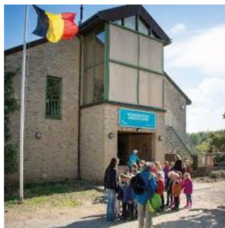
Bezoekerscentrum Webbekoms Broek