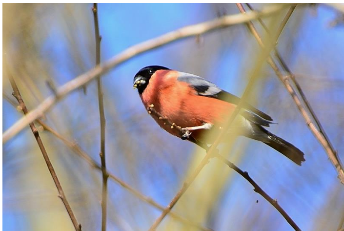
Middelste Bonte Specht – Goudvink